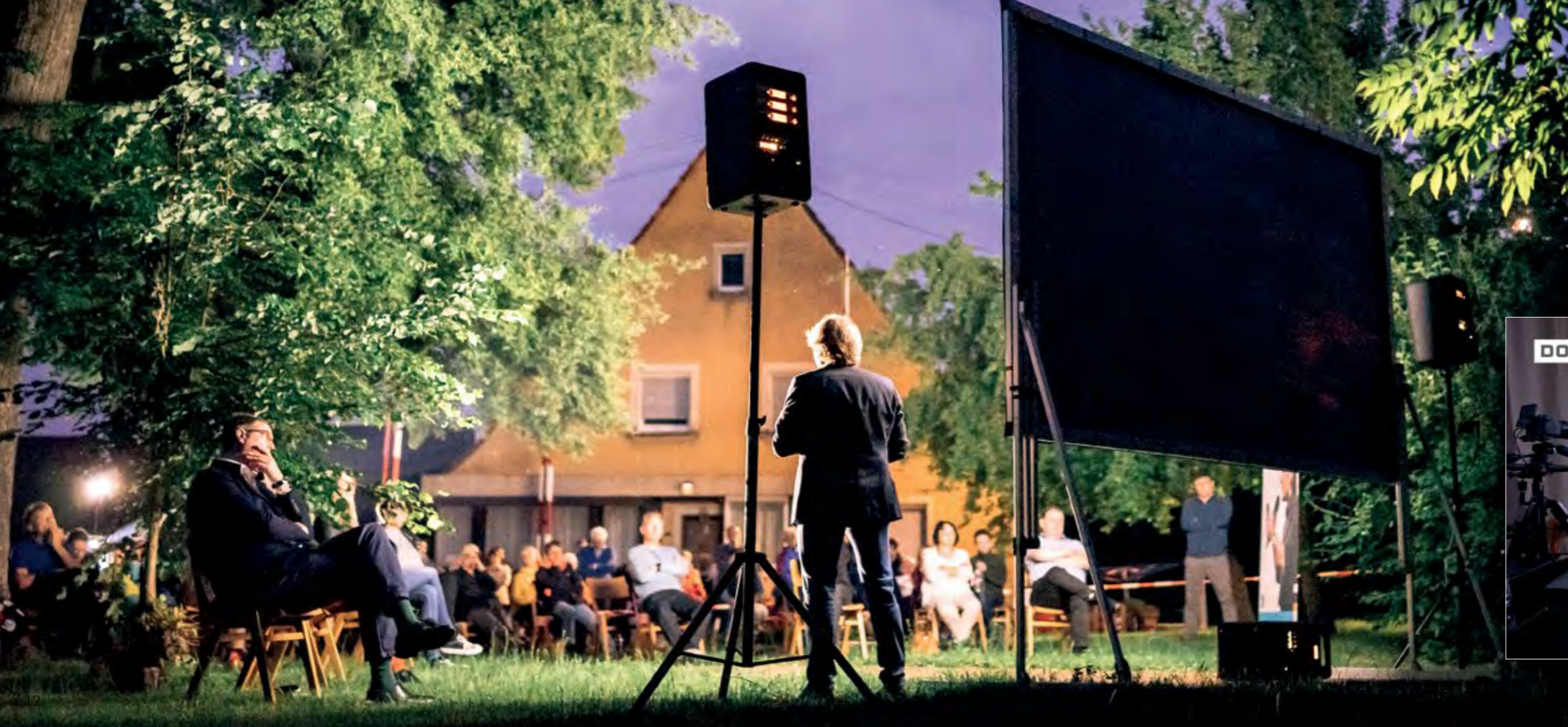
DOKULIVE Open-Air an der deutsch-französischen Grenze in Scheibenhart

Seit 2020 gibt es DOKULIVE auch als exklusiven interaktiven Livestream.