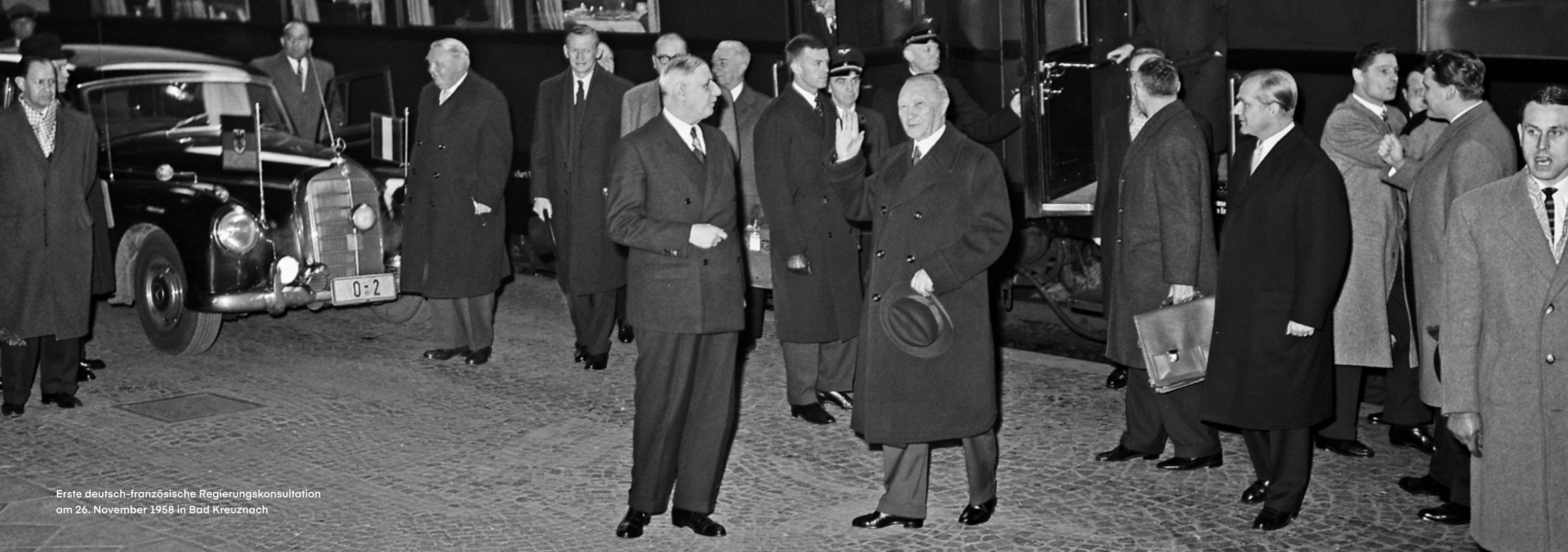
Erste deutsch-französische Regierungskonsultation am 26. November 1958 in Bad Kreuznach